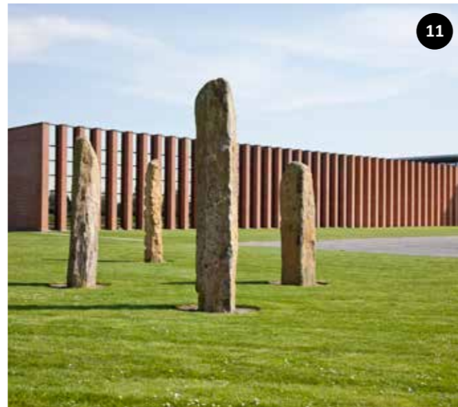
"Skelpæle" Bizonvej 1, Skovby