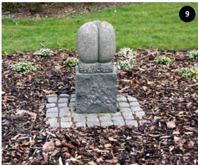
"Spiren" v/Hirsevænget 46a