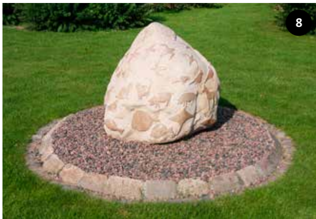
"Ararat", 2007 Porsevænget 34 v/fælleshuset